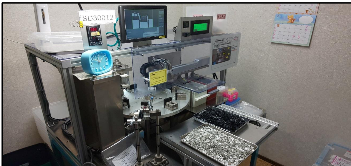
【 自動組立検査機 】