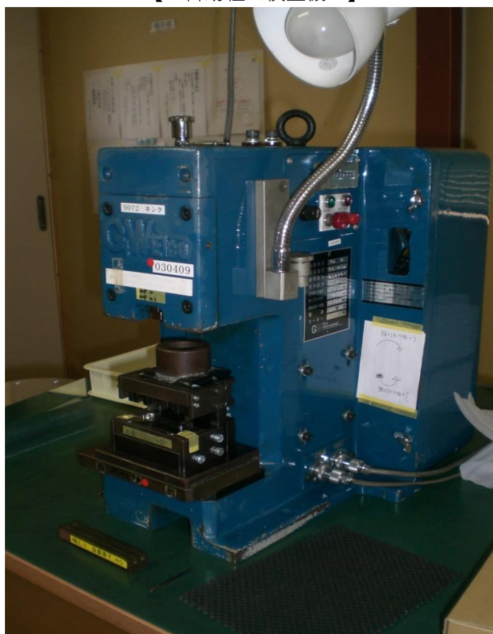
【 圧入治具 】