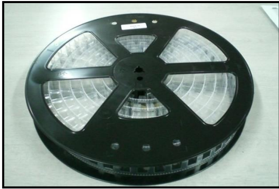
【 レコード巻 】