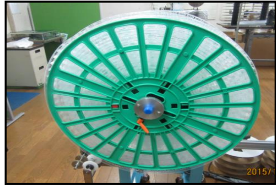
【 スパイラル巻 】